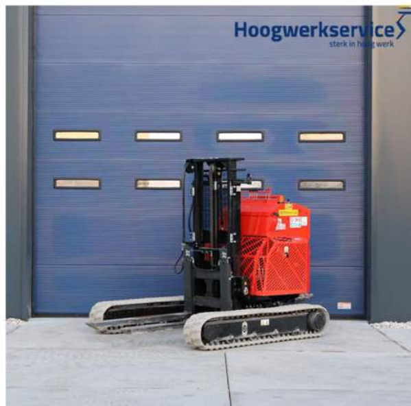
Voorzien van non-marking rupsen